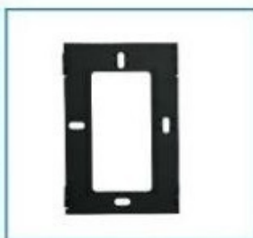
uchwyt montażowy monitora