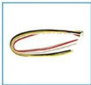
komplet złącz kamera